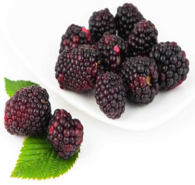
mora de boysen