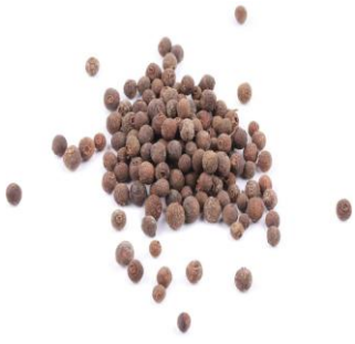
granos de pimienta