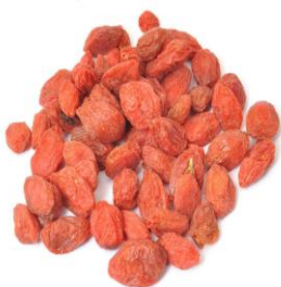
bayas de goji