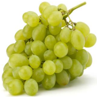
racimo de uvas