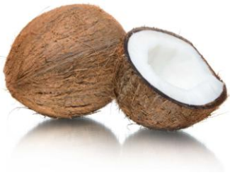
Nuez de coco