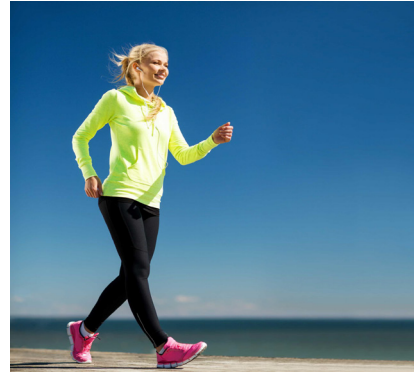
andar , caminar