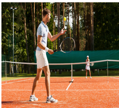
jugar al tenis