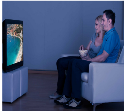
ver la televisión