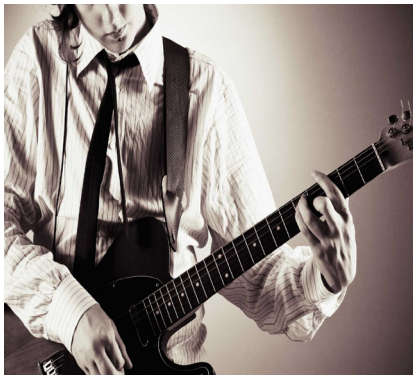
tocar la guitarra