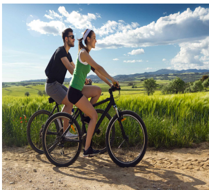
montar en bicicleta