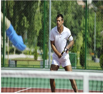
jugar al tenis