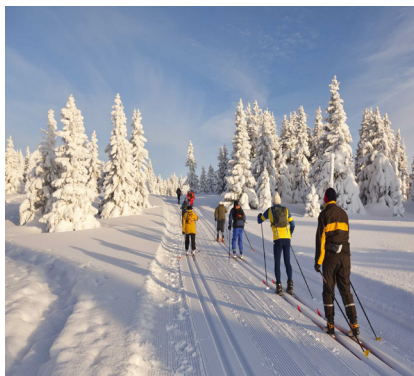
esquí de fondo