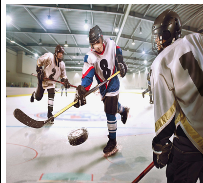
jugar al hockey sobre hielo