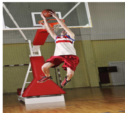
jugar a baloncesto