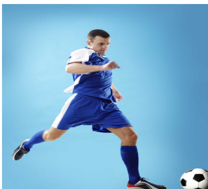
jugar al fútbol