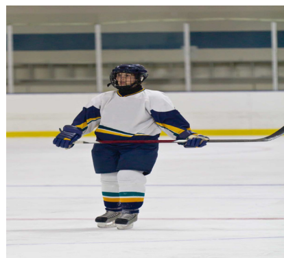
jugar hockey sobre hielo