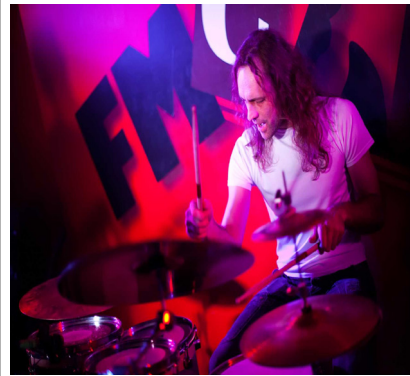
tocar la batería